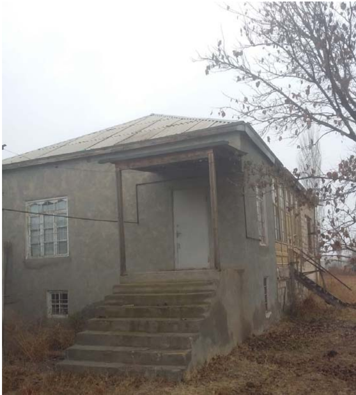
Kamran Əliyevin Diyadin kəndində yaşadığı ev