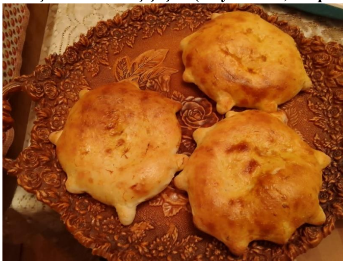
Məməli çöçə (məməli kökə)