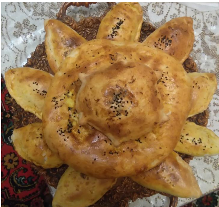
Havuş kökələri: maş çöçəsi (lobyalı kökə) və qalın