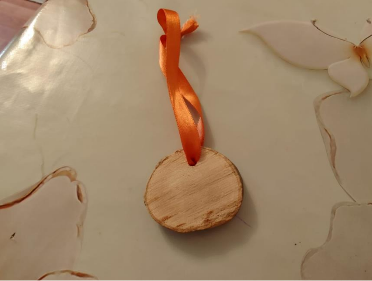
Güz qaytarmaq üçün vasitə, dağdağan ağacından hazırlanıb.