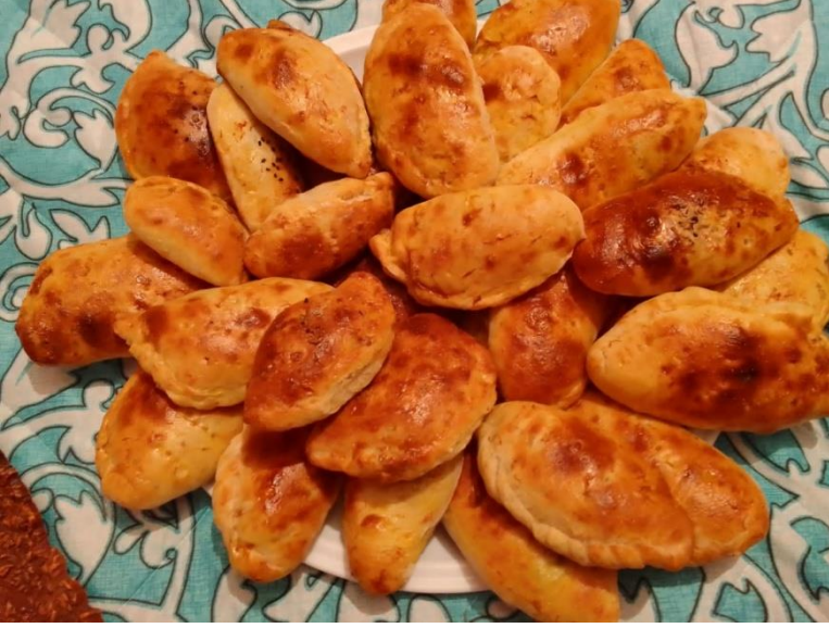
Maş çöçəsi (lobyalı kökə)