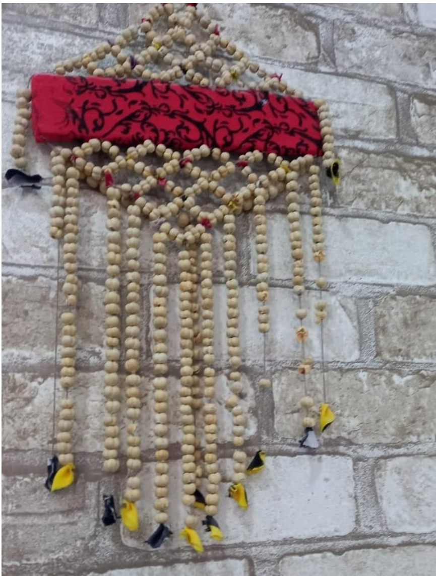
Üzərlikdən toxunmuş bəzək əşyası