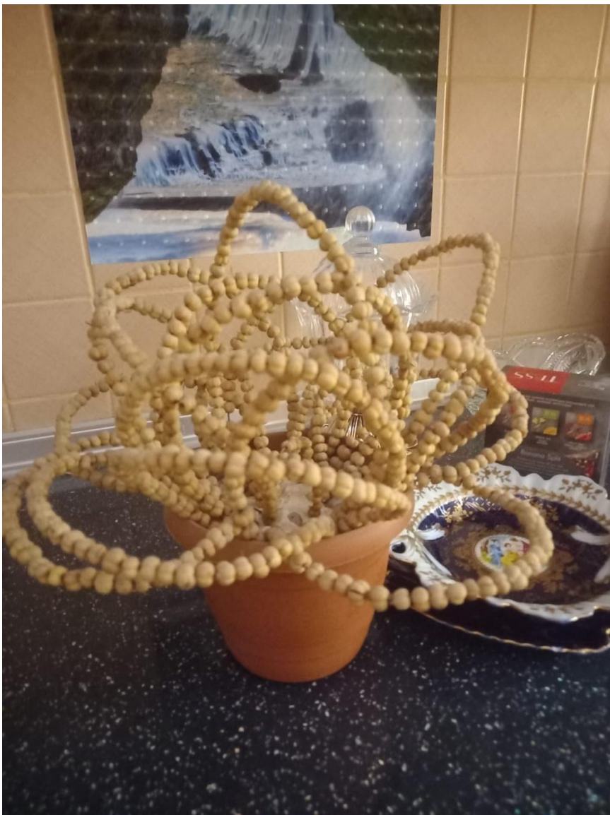
Üzərlik toxumundan hazırlanmış gül