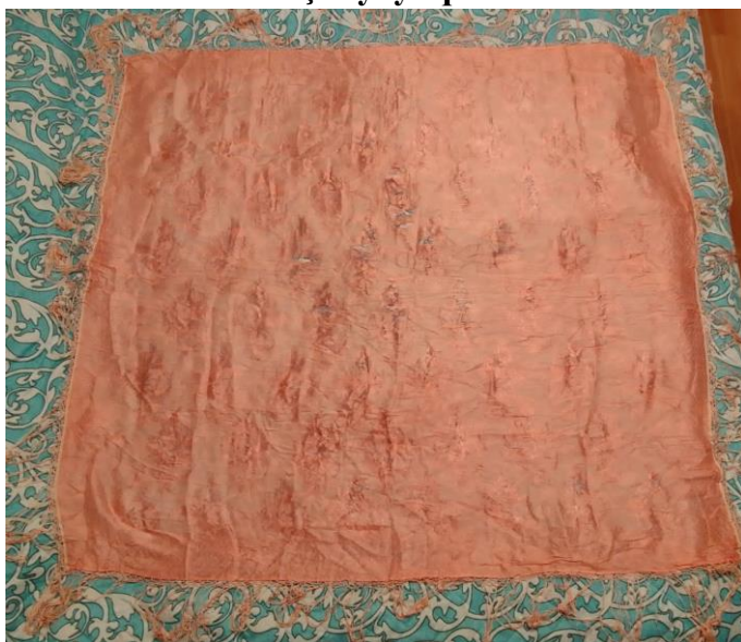
Su rəngi yaylıq, 1952-ci ildə toy üçün alınıb.