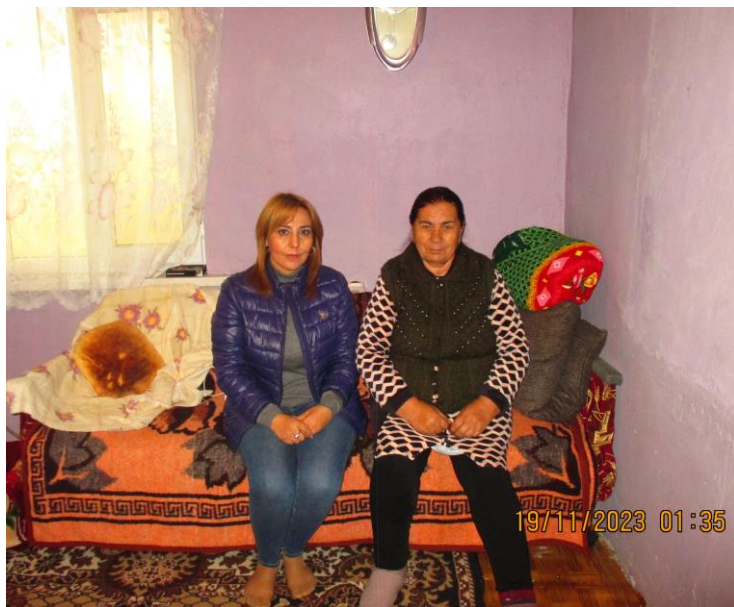
Hüseynova İmperiyalla birgə