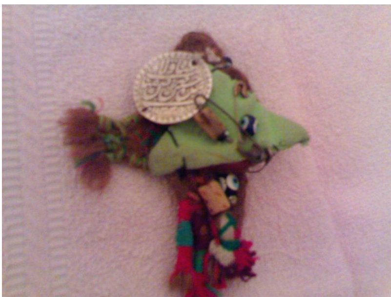
Dualar, göz muncuqları, haqıx və Lailahəilləllah. Kəlbəcər rayonu, Əsrik kəndi