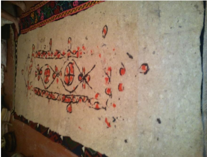
Nəmənd (keçə), Cəbrayıl rayonu, Böyük Mərcanlı kəndi