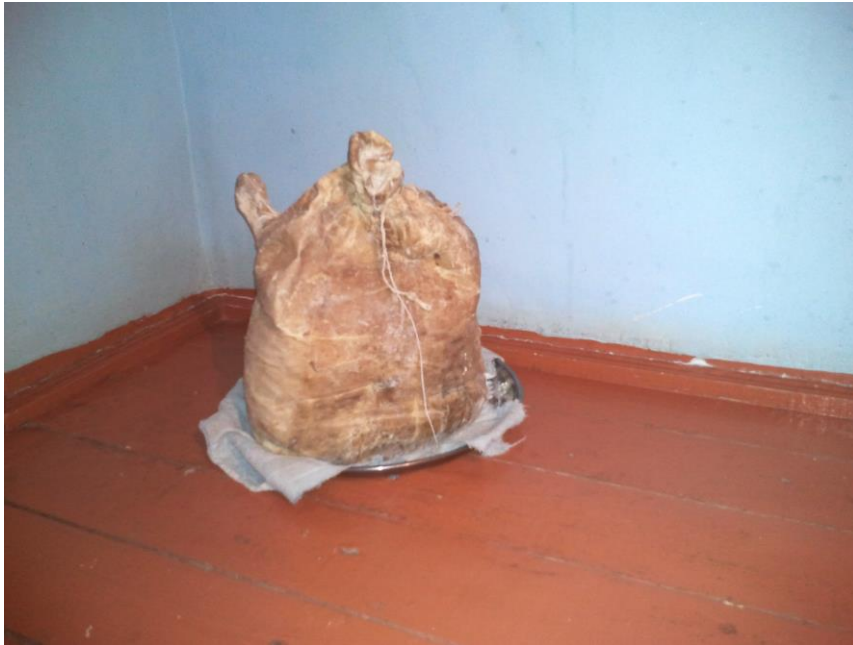
Motal. Biləsuvar rayonu, Cəbrayıl qəsəbələri