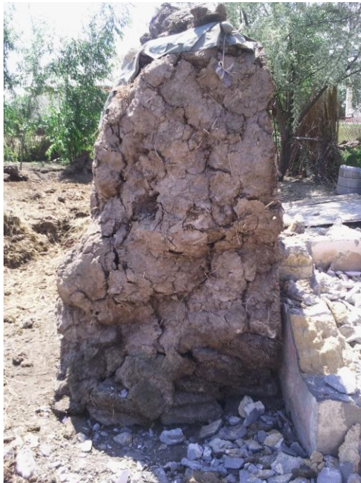
Gərmə qalağı. Biləsuvar rayonu, Cəbrayıl qəsəbələri