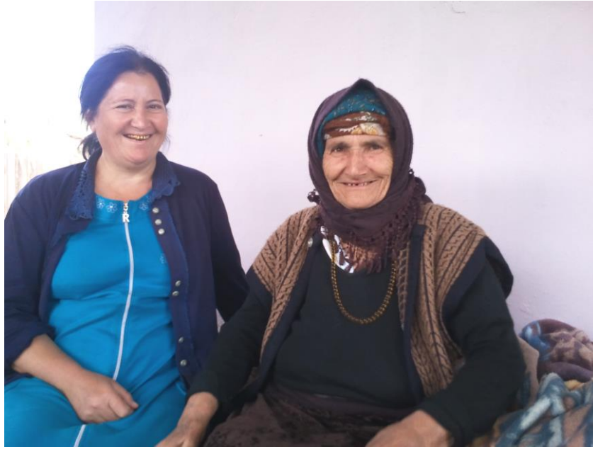
S m dova Valid  M rs l qızı (soldakı), C brayıl rayonu, B y k M rcanlı k ndi v   liyeva  v k t  mil qızı (sağdakı), C brayıl rayonu