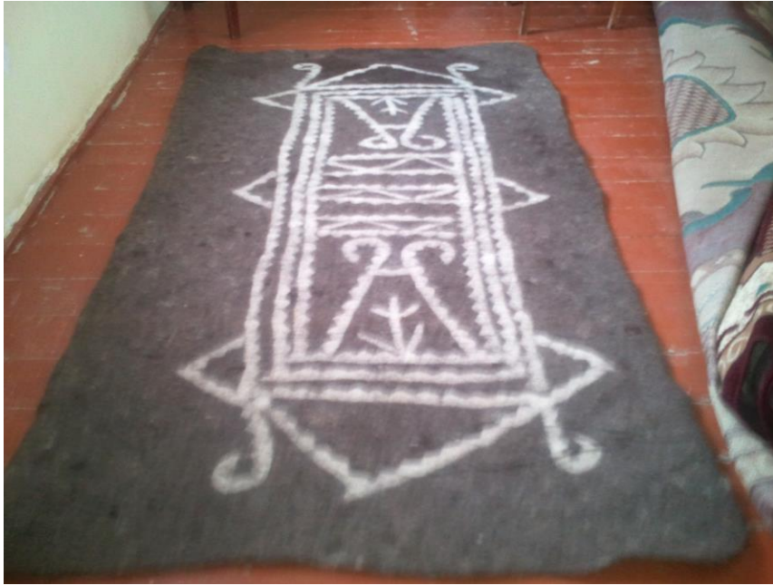
Nəmənd (keçə), Cəbrayıl rayonu, Böyük Mərcanlı kəndi