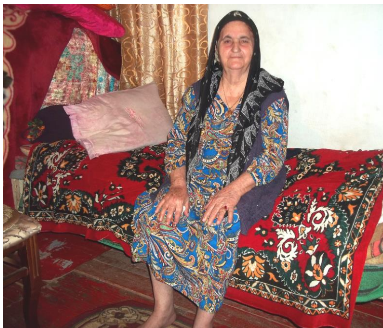
Qəhrəmanova Tavar, Zəngilan rayonu, Çöpədərə kəndi