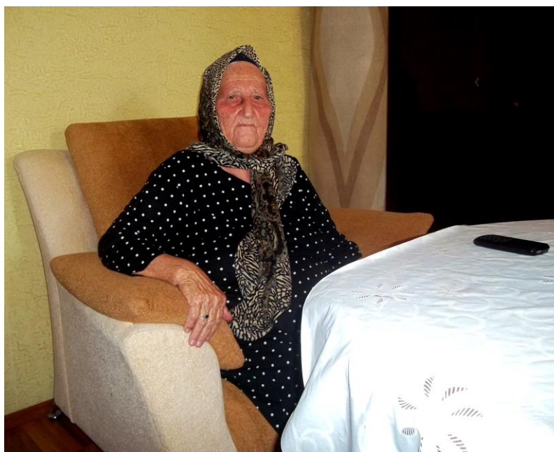
Qurbanova Laləzar, Zəngilan rayonu, Yuxarı Yeməzli kəndi