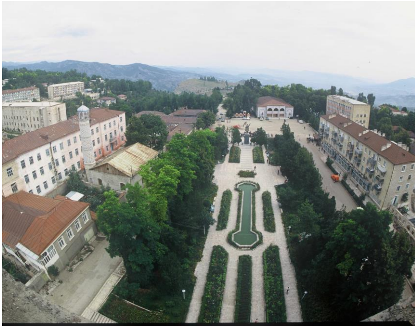
Şuşa, Bazarbaşı meydanı