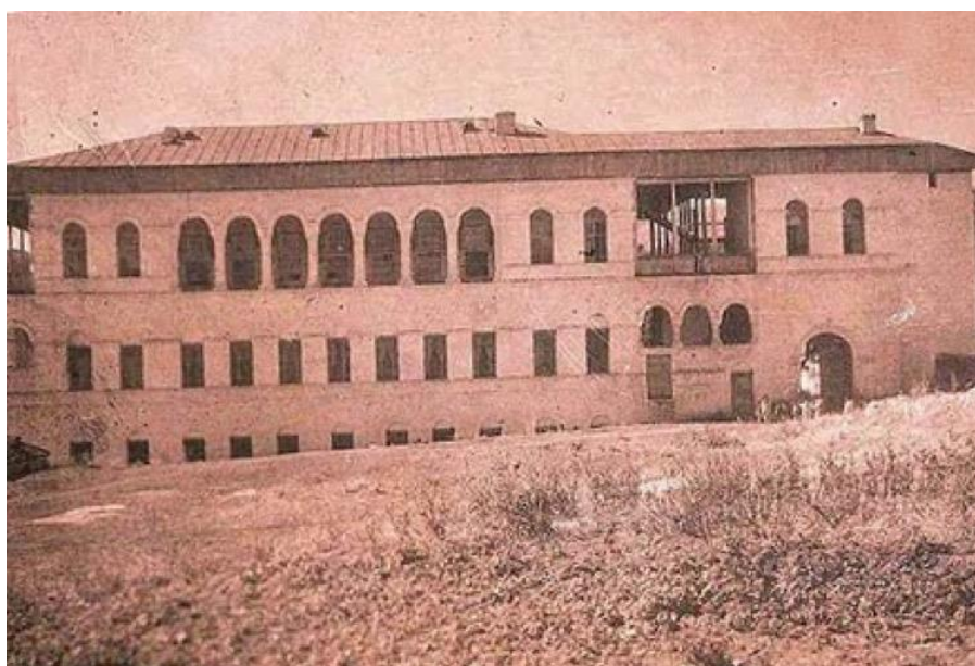
Şuşanın zəngin tacirlərindən Hacı Qulunun evi