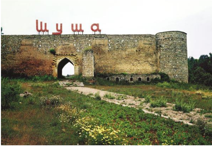
Şuşa, Gəncə qapısı