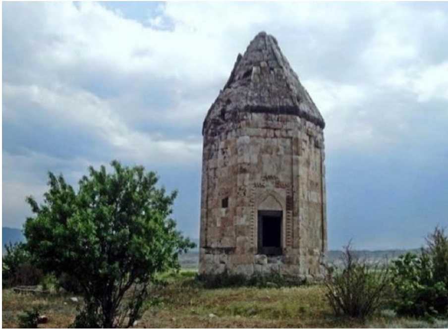
Zəngilan, Məmmədbəyli türbəsi