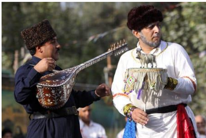
Təkəmçi aşıqla birlikdə mərasim icrası zamanı