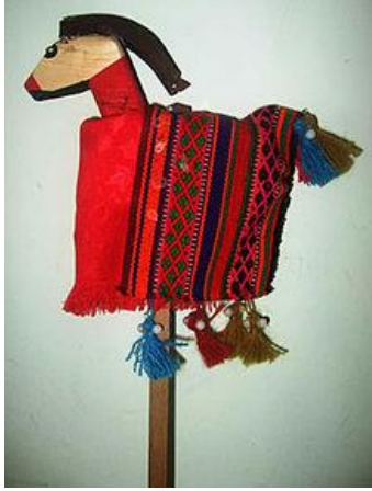
Təkəmçinin əlində oynatığı təkə fiquru