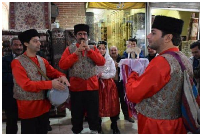
Təkəmçi zurna-davulla birlikdə mərasimdə