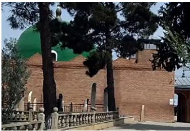
Beyləqandakı Cərciz peyğəmbər ziyarətgahı

Mübariz Aslanovun Cərciz peyğəmbər ziyarətgahına həsr etdiyi məqalədə diqqəti çəkən məqamlardan biri də türbənin tərəkəmə türklərinin yaşadıkları ərazidə yerləşdiyinin vurğulanmasıdır: “Türbənin yerləşdiyi yer Beyləqan rayonunda məskunlaşan tərəkəmə kəndlərinin əhatəsindədir. Əlinəzərli, Dünyamalılar, Eyvazalılar və Aşıqlı kimi tərəkəmə kəndlərinin əhatəsində olan Cərciz Peyğəmbərin indiyə qədər ziyarətgah kimi qorunub saxlanması elə bu camaatın ənənələrə sədaqətindən irəli gəlir” . [1]