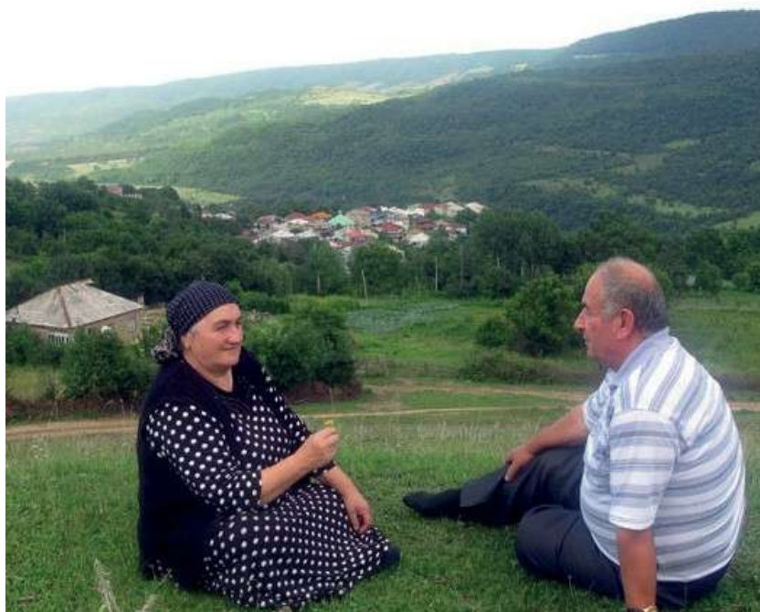
Аюб ва Истемаз Жаруллаевар Чехи Муругъин фолклордал рикI алайбур я