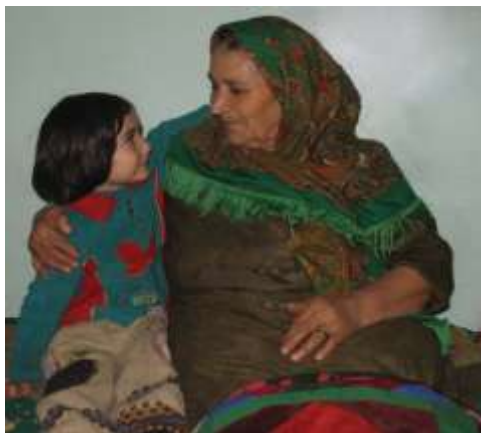
Зарханум Бедирхановади (Гадацгийихуър) вичин хтулдиз баядар кІанарзава