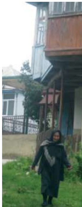
Чехи Муругъ хуьре