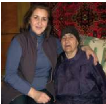
Яламада Магъият бадедин кылив