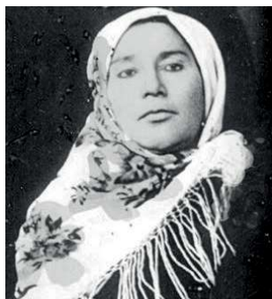
Манкъулидхуъруьн- вийрин мецера къе- далди Эминат Мала тиловадин баядар ама