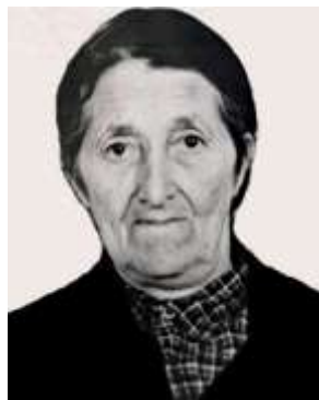
Зи баде Гъуланбиги