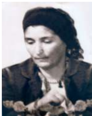
Зи диде Куьбра