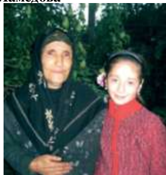
Исмаиллы райондин Смугълурин хуьруьн эгъли Ширван баде