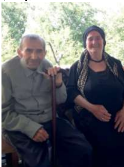
Пирал хуьруьн рехибур Темирханни Гъалият Агъамирзеевар