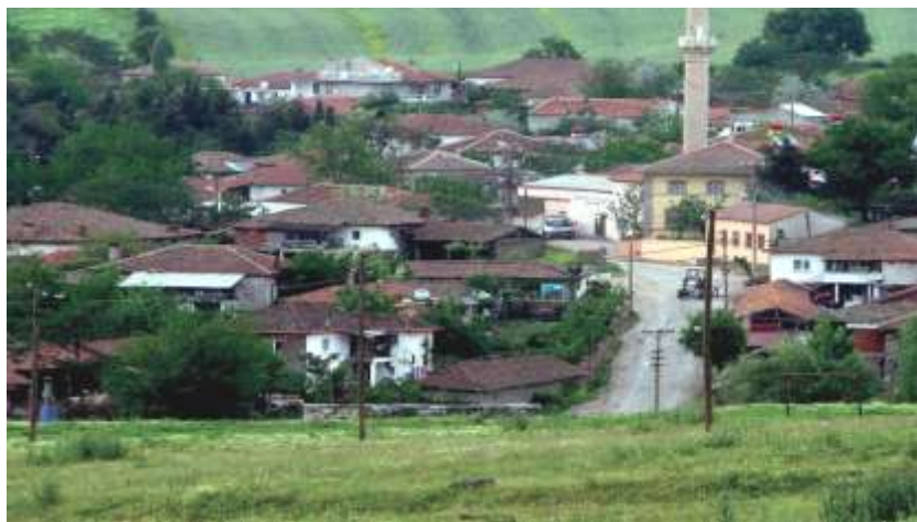
Туьркия Республикадин Балыкесир виляятдин Кирне хуьр