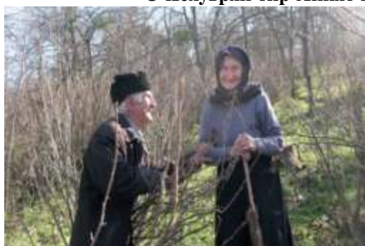
Гуылжейран бадедин кылив (Аваран)