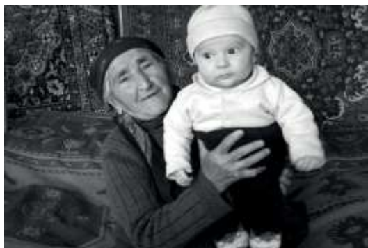
Аварандай тир Шагънигар баде