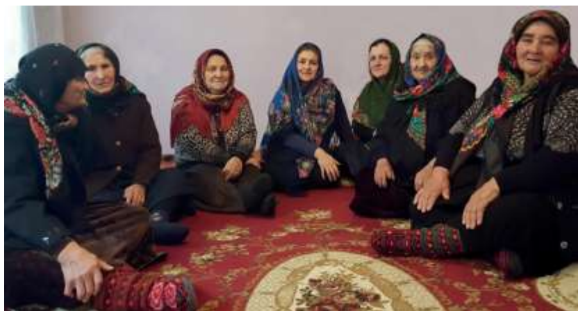
ГадацIийихуьре баядрин меле