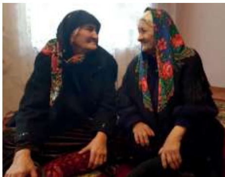
ГадацИйихуърйй тир Гуьлдесте бадедини Эзине бадеди баядрал илигнава