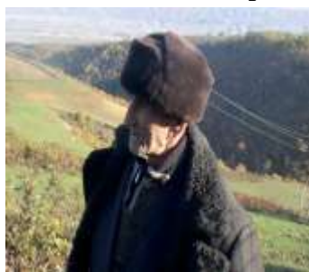
Чпирви Мирземегамед халу