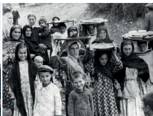
Лезги мехъер (1958-йис)