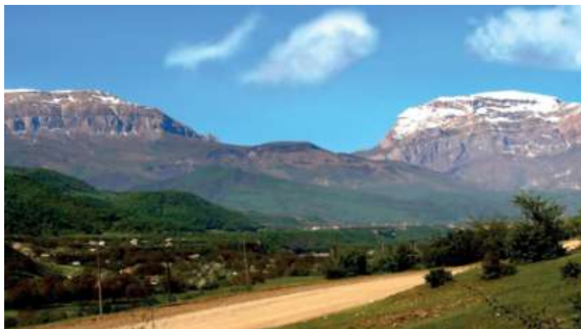
КцIарай дагьларин ақунар