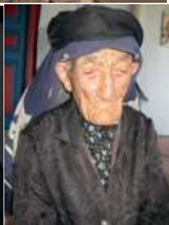
Седеф баде (Тигьиржал)