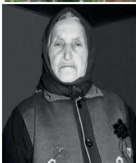
Эбинат баде (ГадацИийихуър)